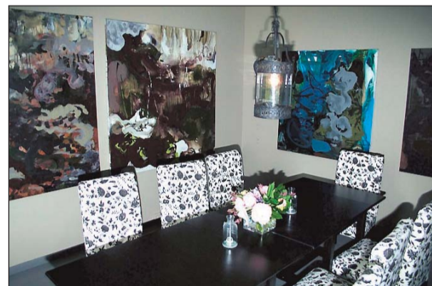
INTERIØR: I slusemesterboligen i Vrangfoss.

Kanalen stått for, med interiørmessig bistand av Bakkes makker, interiørdesigneren Anemone Wille Våge. Kanskje mest kjent for sitt arbeid med Kongeparets private leilighet på Slottet.